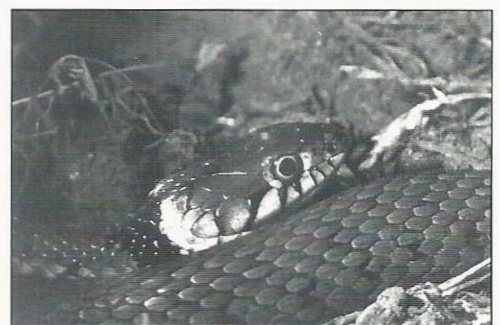
Couleuvre à collier

C'est une espèce semi-aquatique qui se rencontre principalement autour des rivières, des mares ou des étangs. La forêt de Fontainebleau constitue la limite septentrionale de la répartition de ce serpent en France. Elle est d'ailleurs très rare et présente seulement dans deux mares de cette forêt (Doré, 1989). La reproduction est régulière dans une des deux