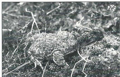
Crapaud des joncs

Cette espèce fréquente les milieux sablonneux, les gravières ; c'est une espèce pionnière qui préfère les zones peu profondes où la végétation est peu dense. Le crapaud des joncs est rare en forêt de Fontainebleau car il ne dispose pas de milieux favorables. La seule population que nous avons trouvée est localisée dans la plaine de Chanfroy. Cette population était menacée par l'assèchement des mares, et par l'envahissement du milieu par