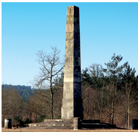
L'obélisque de la Croix-de-Toulouse

■ l'obélisque du carrefour de la Croix-de-Toulouse. La croix érigée en 1725 à la demande de Louis XV, en l'honneur du comte de Toulouse, Grand-Veneur, était composée d'une colonne de marbre provenant de la salle de la Belle-Cheminée du château, surmontée d'une croix. La