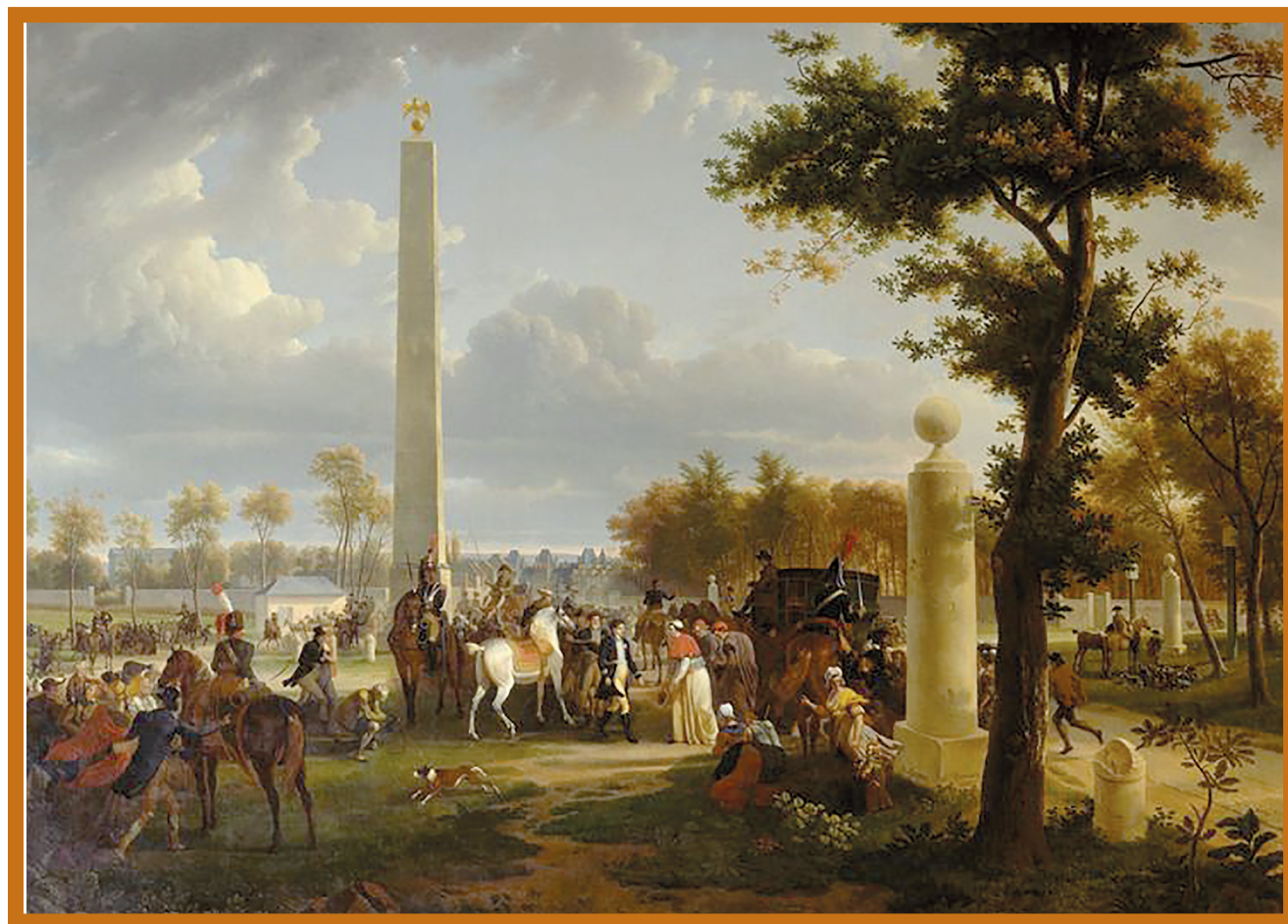
L'obélisque de Marie-Antoinette surmonté de l'aigle impériale. La rencontre de Napoléon I er avec le pape Pie VII. (Tableau de Demarne et Dunouy. Château de Fontainebleau)

Depuis, les veneurs continuent à se répérer dans les différents cantons grâce à ces très jolis monuments que nous ont légués les rois qui ont tant aimé chasser à courre en forêt de Fontainebleau ■