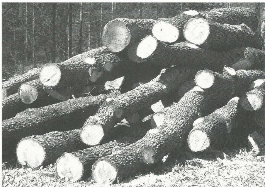
Triage de Franchard, 1993

Comme pour toute vente aux enchères, le public est admis. La vente est réalisée en présence du préfet, ou de son représentant. Il assure le caractère officiel de la vente, par sa seule présence.