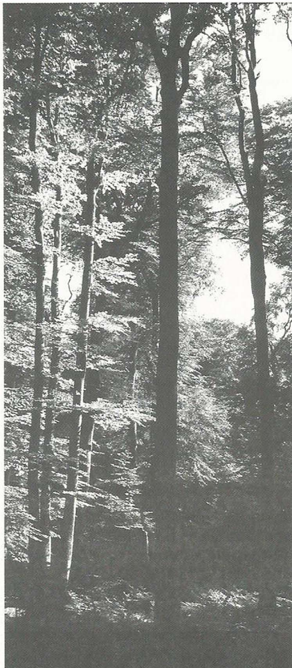
Hêtraie aux Huïts Routes

A proximité immédiate des villes, là où le public peut s'indigner de voir des tracteurs employés à tirer des grumes pour les débusquer, l'ONF imposait aux adjudicataires l'emploi de chevaux. Très écolo-