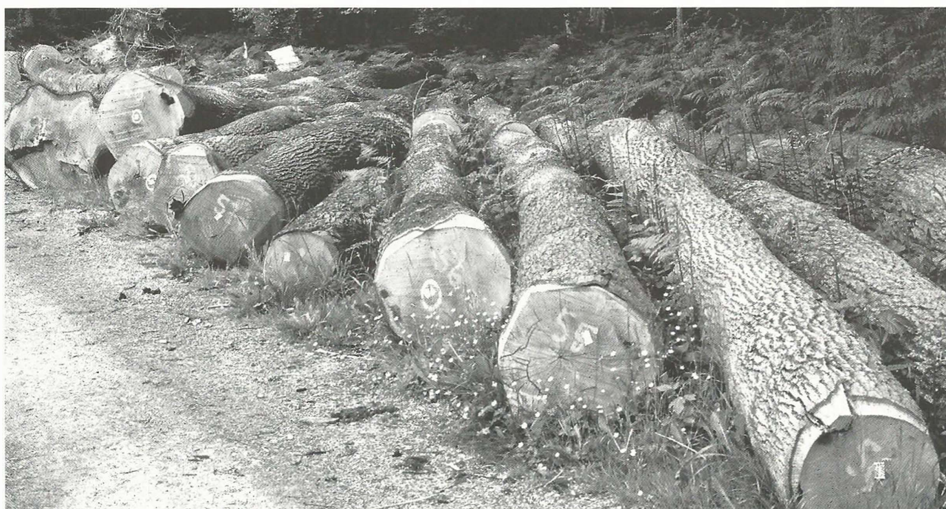
La Boissière, 1990.

Autre chose qui nous fait grand plaisir : Depuis un an, on peut lire ces lignes : "Sur plusieurs coupes, l'utilisation de la peinture par certains exploitants conduit à porter atteinte à la qualité esthétique et paysagère de nos forêts. Nous vous remercions de procéder à vos repérages de manière très discrète afin de préserver le paysage forestier et d'éviter une réaction de rejet de la part du public qui ne pourrait que porter atteinte à l'image et à l'action de la filière."