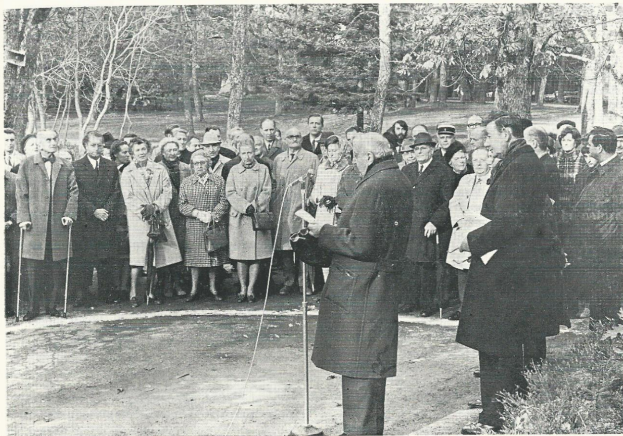
A Franchard, le 15 novembre 1969, pendant le discours du Président Henri Deroy

CETTE PLAQUE A ETE APPOSEE ICI LE 15 NOVEMBRE 1969 POUR RAPPELER LA CREATION DE L'UNION INTERNATIONALE POUR LA CONSERVATION DE LA NATURE ET DE SES RESSOURCES FONDEE LORS DE LA CONFERENCE TENUE AU PALAIS DE FONTAINEBLEAU DU 30 SEPTEMBRE AU 7 OCTOBRE 1948.