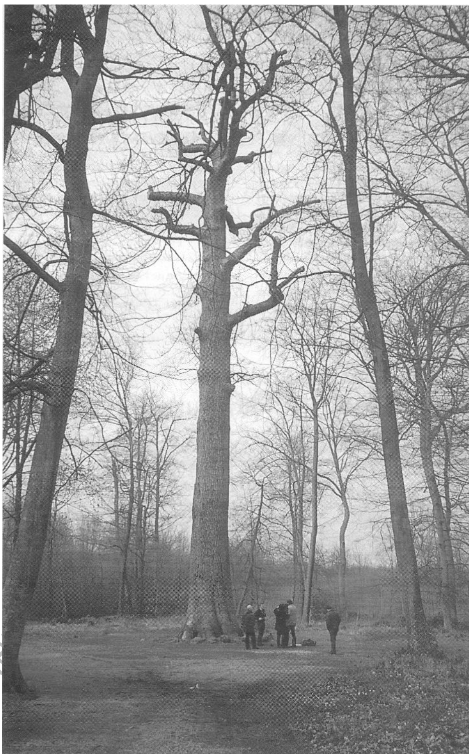
Le chêne Jupiter, le 13 avril 1994