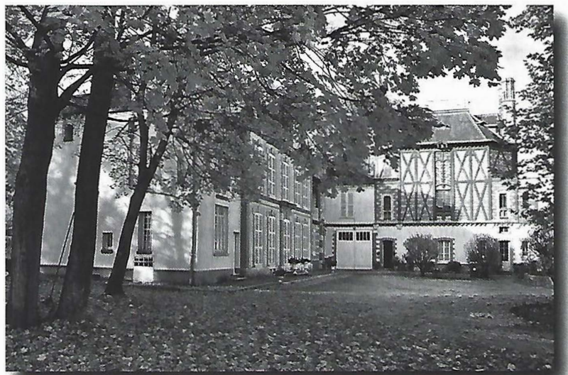
Le château et l'atelier de Rosa Bonheur

En 1859, le peintre animalier Rosa Bonheur, femme à la personnalité marquante, fait l'acquisition du château de By et s'y installe, à l'orée de la forêt, loin de l'agitation parisienne. Aujourd'hui, la partie ouverte à la visite se compose de l'atelier de l'artiste, qui reflète avec exactitude l'atelier d'un peintre de renom au XIX e siècle, d'un petit bureau et d'une salle d'études dans laquelle les